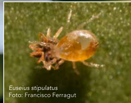
Euseius stipulatus