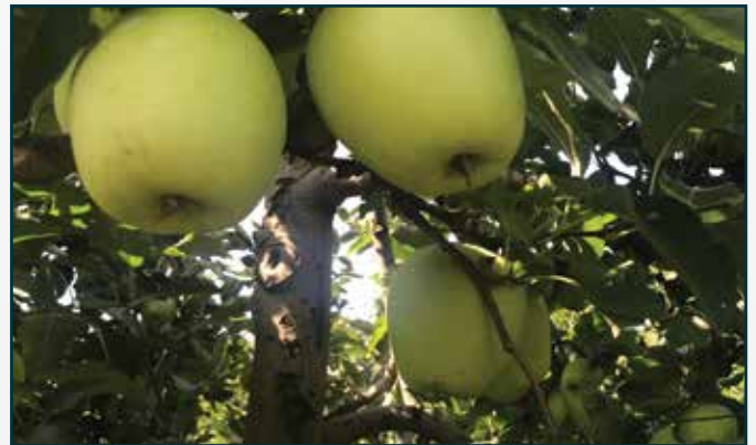
Manzanas tratadas con KARBICURE® 85 totalmente sanas

Eficacia de KARBICURE® 85 contra Monilia en nectarina.