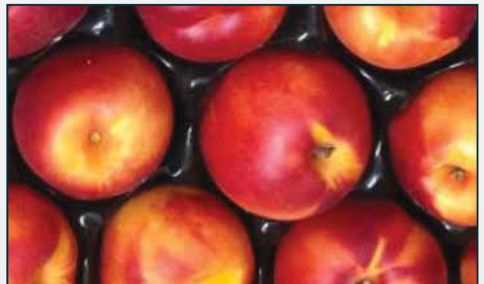
Fruta tratada con KARBICURE® 85 .