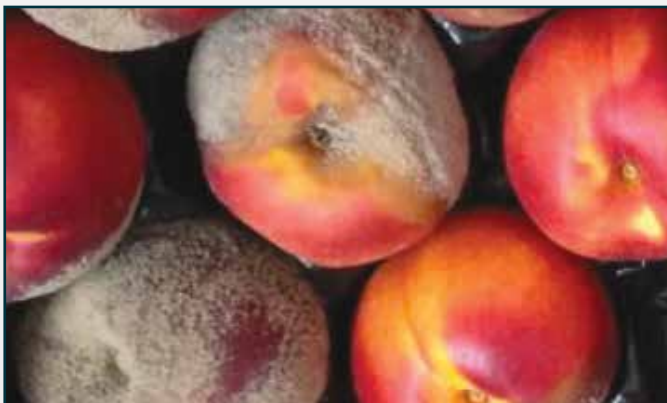
Infecciones graves de Monilia después de la cosecha.

Eficacia de KARBICURE® 85 contra Monilia en nectarina.