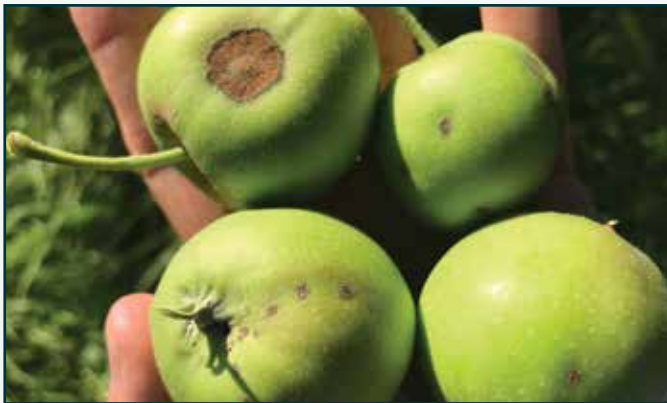
Testigo sin tratar: Daño severo de moteado en manzana sin tratar.

Eficacia de KARBICURE® 85 contra moteado en manzano.